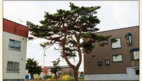
▲早山家のアカマツ(現在は撤去)