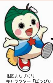
北区まちづくり キャラクター「ぼっぴい」

作者コメント：伏籠川周辺によく川霧が発生します。 それが木々に着氷し、気温が上昇すると消えてしまいます。