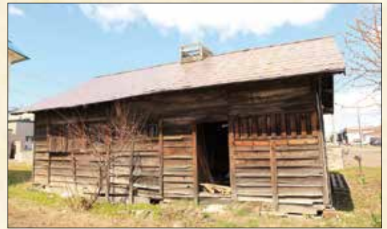
▲新琴似屯田兵屋(現在は解体)

ぜひ、スマートフォンを片手に現地でしか味わえない北区の歴史や文化を感じてください。