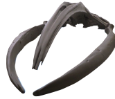
▲小金涌産クジラ化石骨格標本 全長14m(写真は頭部のみ)

「すべては、つながっている」をテーマに、札幌の自然やその成り立ちを紹介。札幌で発掘されたクジラ化石標本のお披露目や学芸員のトークイベント、ワークショップも実施します。