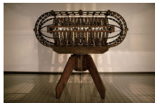
熊谷文秀(DIALOG MACHINE 2)2021年

札幌を拠点に活躍するアーティストを中心とした美術展。今回は、感染症の世界的大流行の中で、自然と人の関係や人と人との結びつきをテーマに、私たちの現在を探る作品が並びます。