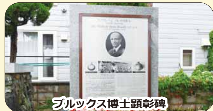
ブルックス博士顕彰碑