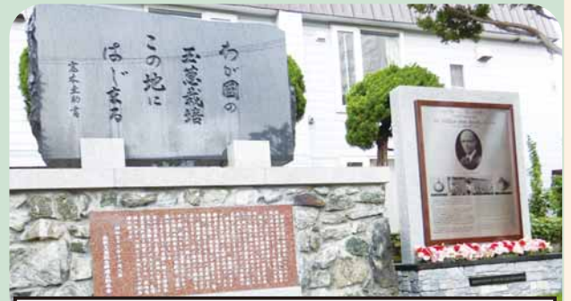
札幌玉葱記念碑と並び立つ ウィリアム・ペン・ブルックス博士顕彰碑

札幌の歴史、東区の歴史が感じられる場所です。ぜひお立ち寄りください。 (札幌村郷土記念館 東区北13条東16丁目2-6 ☎782-2294)