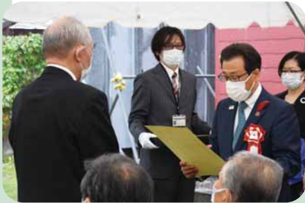
札幌村郷土記念館保存会の橋場善光会長に感謝状を渡す秋元克広札幌市長