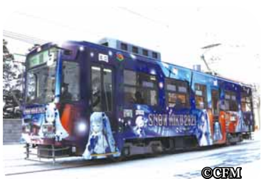
▲前回運行時の雪ミク電車