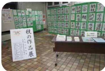
▲過去の作品展の様子