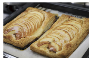
▲キッズ・シェフで作られたアップルパイ

畑の広さは1.2ヘクタール。りんごの木は200本近くあり、23種類作っているよ。それぞれ収穫時期が違い、一番早いのは8月半ばに収穫時期を迎える「ビスタペラ」。酸味が強いからジャムにするのがおすすめ。その他のりんごの多くは9〜11月に収穫のピークを迎えるね。