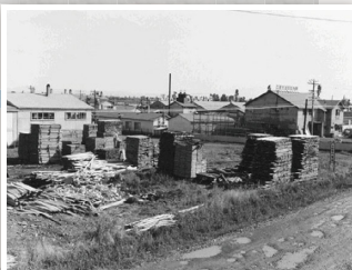
1963年頃の木工団地の様子