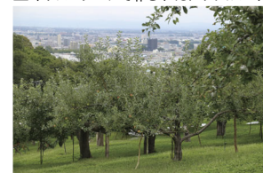
▲三角山登山口の隣にある同園 晴れた日は海まで見えるそう