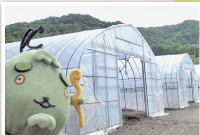
小別沢にある小松菜農園にお邪魔したよ