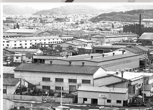
1974年頃の鉄工団地の様子