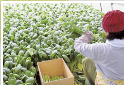
収穫は、カマを使って1株1株手作業で