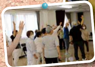
◀▲ 前田中央会館 (前田地区) の活動