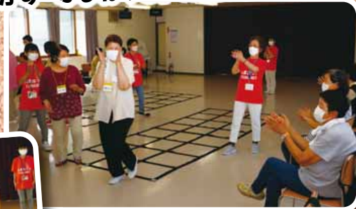
手稲中央会館 (手稲地区) の活動