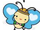
介護予防センターイメージキャラクター「かよるん」

介護予防は毎日の積み重ね。ぜひ自宅でも取り組みを。介護予防センターでは、「通いの場」の活動と合わせて、自宅での介護予防の取り組みも応援しています。「運動」のほかにも「お口の健康」や「栄養」など、日常の介護予防のポイントを広く紹介していますので、介護予防センターまで気軽にお問い合わせください。取り組みの記録を残せる「介護予防手帳」もお配りしています。