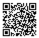
【ライブ配信専用ページ】

他 ウェブによるライブ配信を行います。視聴には左のコードから専用ページに入り、事前登録が必要です。