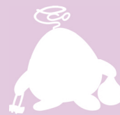
西区環境キャラクター さんかくやまべエ