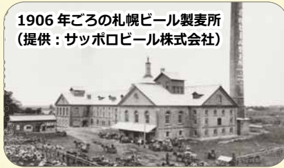
1906 年ごろの札幌ビール製麦所

東区の昔を振り返る「東区今昔」。今月は、札幌の赤レンガ建築を代表する建物「サッポロビール博物館」の昔を紹介します。明治 23 年（1890 年）に札幌製糖会社の工場として建設されたこの建物は、明治 38 年（1905 年）に札幌麦酒会社が改修し、製麦工場として稼働しました。その後、昭和 41 年（1966 年）にサッポロビール園・開拓使麦酒資料館としてオープン、昭和 62 年（1987 年）にサッポロビール博物館として改装された日本初のビールに関する専門博物館です。