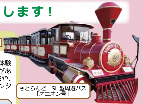
さとらんど SL 型周遊バス 「オニオン号」

＜お問い合わせ先＞ サッポロさとらんど (札幌市農業体験交流施設) ☎787-0223