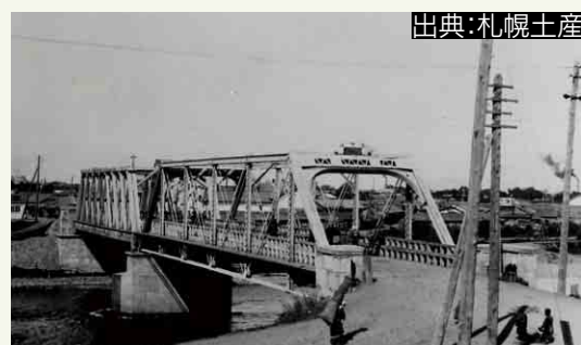
▲鉄橋となった豊平橋