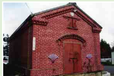
▲現存するレンガ倉庫 ※個人の所有物ですので、見学にはご注意ください。

福住地区には、レンガ造りの倉庫が点在しています。これらは、主にリンゴ倉庫として使用されていたもので、最盛期の1950年（昭和25年）ころには22町歩（約22ha）ものリンゴ畑が広がっていたそうです。宅地化が進むにつれて、数は少なくなりましたが、当時の面影を今に残しています。