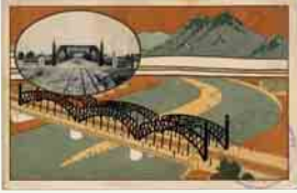
◀豊平橋開通記念絵はがき

その後、応急的に仮橋を架けてしのいでいましたが、まちの発展と共に、行き交う人や馬車などが増え、危険な状態となりました。そこで約3年の年月をかけ大正13年に完成したのが、名橋と名高い旧豊平橋です。橋につながれた現在の国道36号は当時より重要な幹線道路であり、また路面電車が橋を通ったことにより、豊平橋はさらに必要な交通拠点となりました。