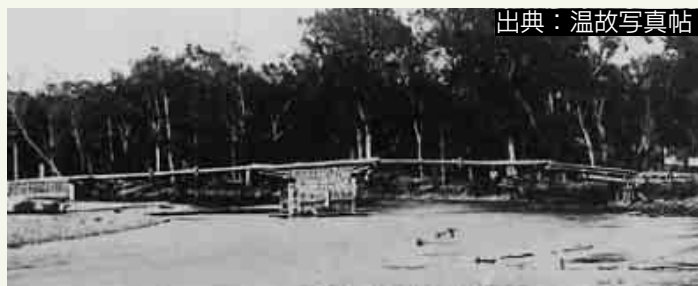
▲明治初期の豊平橋