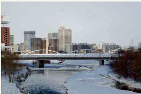
▲現在の橋。白いアーチは「豊平川第一水管橋」のもの

日々多くの方に利用されている豊平橋。この橋が完成に至るまでには、多くの先人たちの努力や苦勞がありました。数々の時代を越えて人や物をつなぎ、当時の優れた技術を集結させて何度も生まれ変わったこの橋は、今も私たちの生活を支え、まちの発展を見守り続けています。