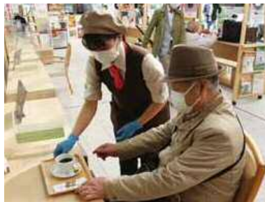
▲ 心のこもった丁寧な接客も魅力のひとつ。

白石区複合庁舎1階ロビーの一角に、温かな雰囲気のカフェがあることをご存知でしょうか。ここ「元気カフェ Blanc」では、障がい者雇用の促進を図ることなどを目的に、障がいのあるスタッフも働いており、接客や調理、メニューの考案などあらゆる業務をスタッフ全員で協力して行っています。