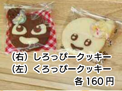
(右) しろっぴークッキー (左) ぐろっぴークッキー 各 160円