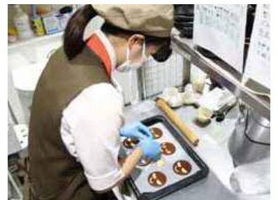
▲ クッキーの表情がどれも微妙に違うのも、手作りならではの。

自慢のコーヒーは区内にある専門店から仕入れてお楽しみください。 白石区複合庁舎にお越しの際は、ぜひ元気カフェをご利用ください。 みのもひとつです。 り、フードメニューもほとんどが店内手作り。夏はかき氷、冬は甘酒など、季節ごとの限定メニューも楽しみのもひとつです。