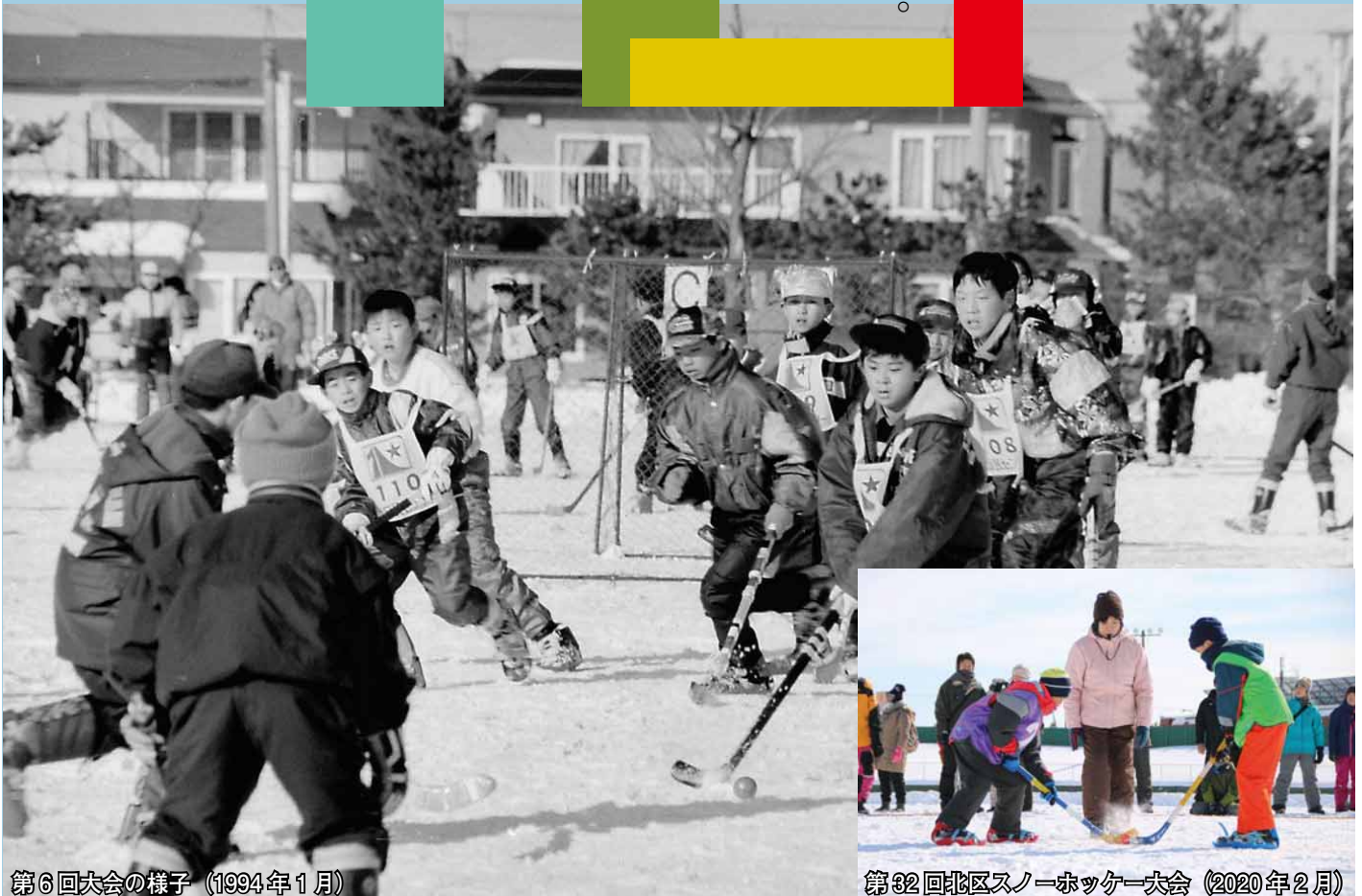
第6回大会の様子 (1994年1月)