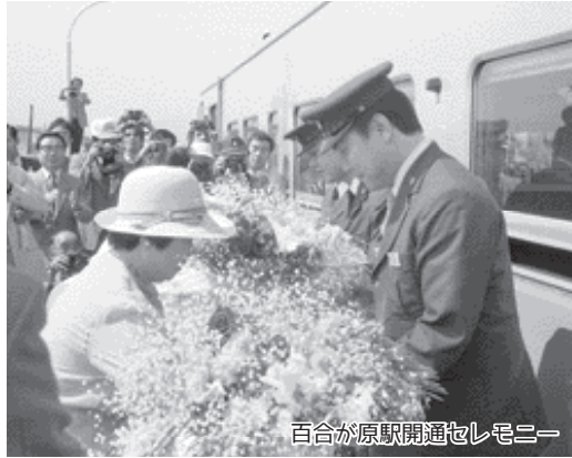
百合が原駅開通セレモニー