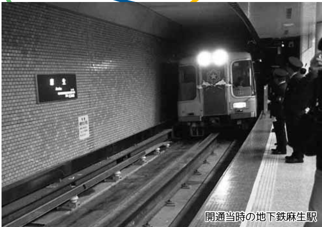
開通当時の地下鉄麻生駅

昭和47(1972)年の札幌オリンピック開催に向けてその前年の12月に開業した札幌市営地下鉄南北線。真駒内と北24条とを結ぶものだったが、昭和53(1978)年には麻生まで延伸。地下鉄麻生駅は、北区北部や石狩の人々を都心へと運び、また、麻生地区を活性化する拠点として、市民の生活に大きな影響を与えた。