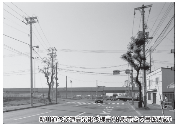
新川通の鉄道高架後の様子

市街地の発展と交通の円滑化のために始まった鉄道高架事業。昭和63（1988）年にはJR札幌駅の高架化が完了し、それまで鉄道施設により南北に分断されていた道路がつながったことで、札幌駅周辺部の発展は加速した。札幌駅高架下にはその翌年、ショッピングモールのほか、国際情報コーナーや福祉コーナーなどを備えた「ライラックパセオ」が開業し、多くの市民が足を運んだ。