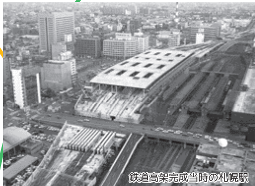
鉄道高架完成当時の札幌駅

市街地の発展と交通の円滑化のために始まった鉄道高架事業。昭和63（1988）年にはJR札幌駅の高架化が完了し、それまで鉄道施設により南北に分断されていた道路がつながったことで、札幌駅周辺部の発展は加速した。札幌駅高架下にはその翌年、ショッピングモールのほか、国際情報コーナーや福祉コーナーなどを備えた「ライラックパセオ」が開業し、多くの市民が足を運んだ。