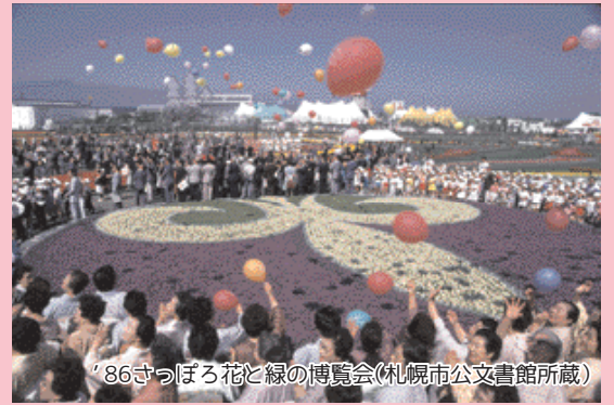
86さつぼろ花と緑の博覧会

百合が原駅ができたことで、畑ばかりだった百合が原の宅地化が進んでいったという。「畑が減り、農家としては大変な時期もありましたが、札沼線を利用して、いろんな地域の方が百合が原に来やすくなり、タマネギなどの野菜を買ってくれるようになったことがうれしかったです」と当時を懐かしんだ。