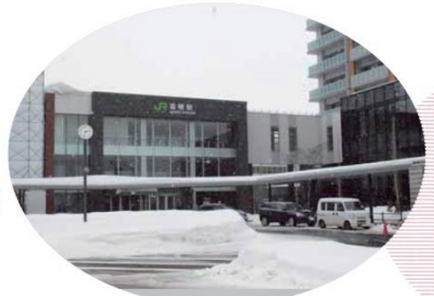
▲現在の様子(令和4年1月撮影) ◀昭和52年頃の様子