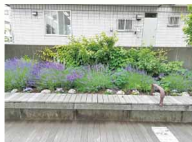
↑地下鉄新さっぽろ駅2番出入口前花壇の植え替えの様子