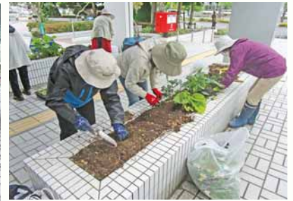
厚別区役所前花壇の植え替えの様子↑