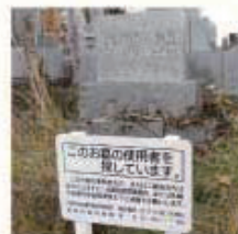
▲市営霊園のお墓の約2割に当たる1万基が無縁墓の疑い(2018年度調査)