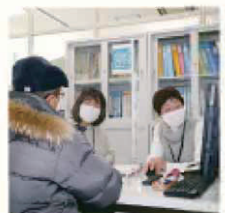
▲看護師やケアマネジャーなど、経験豊富な相談員が対応