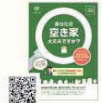
▲市のパンフレットは区役所(1ページ)やホームページなどで配布中

実家が空き家になったら…… 持ち家をどうするか考えておくことも大切。空き家として放置すると劣化が早く、景観を損ねてご近所に迷惑をかけたたり、外壁などの落下や火災で損害賠償責任を問われたりすることもある。