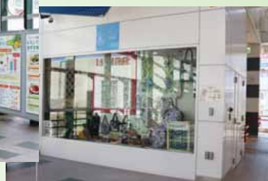
▲広場の両脇にある「あいくるショーウィンドー」