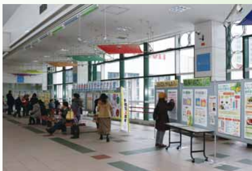
▲現在の「あいくる」広場 ※写真は過去に行われたイベントの様子

「あいくる」の愛称は、「出会い」「愛くるしい」「来る」などの意味が込められており、公募により付けられました。