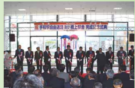
▲完成記念式典の様子

通路にある広場では、パネル展や作品の展示など、年間を通してさまざまなイベントが開催されており、情報交流・活動発表の場として活用されています。