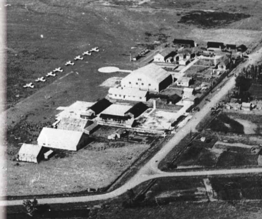
昭和17（1942）年9月

現在、札幌の飛行場といえは、東区にある札幌丘珠空港です。しかし、今夏のオリンピックのマラソンコースとなった北24条西地域に、北海道と東京を結ぶ唯一の航空路を持つ、札幌飛行場があったことをご存じでしょうか。 大正15（1926）年、新聞の記事原稿や報道写真などを運ぶ手段として飛行機を活用していた旧北海タイムス社が、北24条西地域に滑走路を設置したことから、この飛行場の歴史が始まりました。その後、当時の通信省が拡充整備し、道内初の国営飛行場となりました。当初、札幌―東京間の定期航路の所要時間は6時間程度。汽車では27時間ほどかかっていたため、飛行機の速さは画期的でした。また、太平洋戦争中は、製鉄・兵器工場のあった室蘭を守備するため、陸軍飛行隊が配備されるなど、軍用飛行場として活用されました。 昭和20（1945）年の秋、アメリカ進駐軍兵士の放った火炎放射器の炎によって札幌飛行場は焼失してしまいました。現在では、門柱のみが残されています。