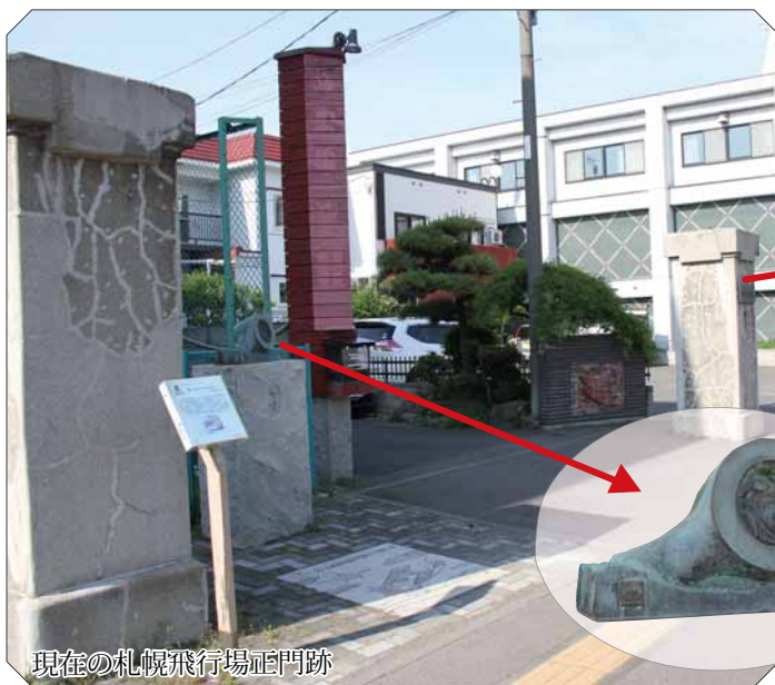
現在の札幌飛行場正門跡

▼東側の門柱には「札幌飛行場」の文字。 現在、門柱の奥には住宅地が広がっています。