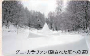
ダニ・カラヴァン《隠された庭への道》