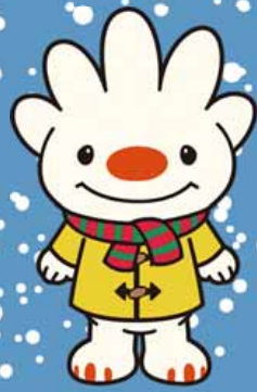
手稲区マスコットキャラクター ていね