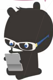
札幌市図書館キャラクター ヨロンくん

【電子書籍サービスに関するお問い合わせ先 中央図書館利用サービス課 ☎ 512-7320】