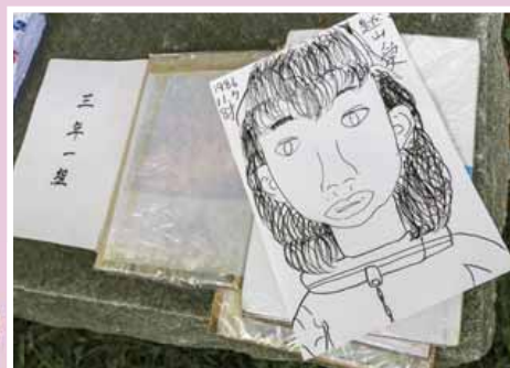
タイムカプセルの中身

※南区の「まちの話題」を発信しています。スマートフォンなどで2次元コードを読み取って、お楽しみください。