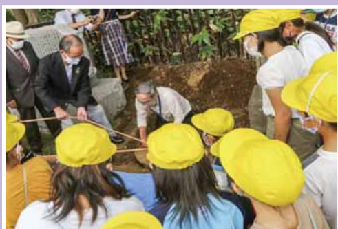
タイムカプセル開封の様子