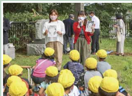
当時の思い出を語る卒業生

9月11日(金)に石山陸橋付近にある望豊台 ぼうほうだい の碑で、望豊台の碑保存会と石山緑小学校の共催による「石山望豊台の碑タイムカプセル開封式」が行われました。タイムカプセルは、同碑が昭和61年に現在の場所に移設されたのを記念し、当時の石山小学校の児童らが埋設したものを。タイムカプセルが開けられると、参加者から大きな歓声上がり、中からは当時の児童らが書いた作文や似顔絵などが取り出されました。