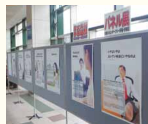
写真：昨年のパネル展の様子