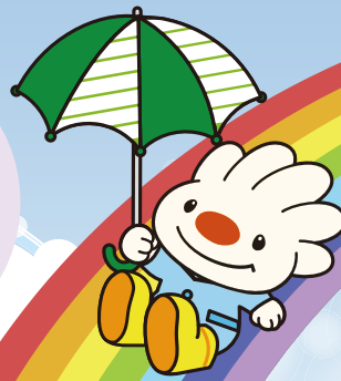
手稲区マスコットキャラクター ていね