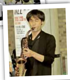
▲ソロ演奏の様子(コトニジャズ)