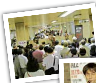
◀コトニジャズの様子

▼そんなコトニジャズの魅力とは? ジャズの生の音を気軽に楽しめるところ。僕たち奏者側も、できるだけジャズに親んでもらえるように、曲の構成やリズム、地下鉄構内独特の音の響きを考えて演奏しています。 機会を頂けていますが、そのきっかけがコトニジャズだったことも多いんです。サクソ奏者として活動する基盤になったと感じています。