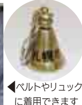
◀ペルトやリュックに着用できます