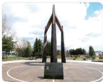
天高くそびえ立つ公園のシンボル「礎」

生活習慣病の予防やストレス解消に効果があるウォーキング。今回は厚別区のコースを案内します。街歩きを楽しみながら、気軽に健康づくりを始めてみませんか。