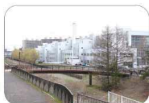
三里川に架かるはまなす橋

1989(平成元)年の国民体育大会開催を記念して、彫刻家・国松明日香氏が制作した高さ16m余りに及ぶ鋼鉄製のモニュメント。道民が北の大地の上に風に向かって毅然として立ち、未来に向かって限りなく飛翔することを願って建てられました。