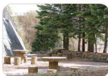
丸木の椅子とテーブルの休憩所

散策路に沿ってゆるやかな弧を描く橋。渡りながらUターンした後は、せせらぎに耳を澄まして川沿いの道を進みます。