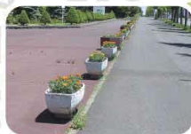
厚別公園入り口の花壇

木目がきれいなテーブルと椅子を備えた休憩ポイント。すぐ横には背の高い針葉樹が並んでいます。