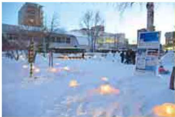
ホワイトジャンボフェスタ2020 1月25日(月寒)