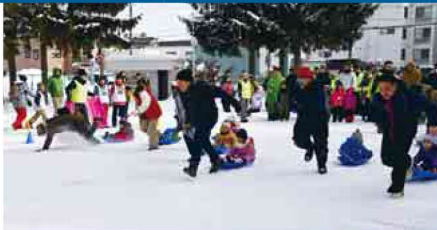
平岸地区雪中運動会 2月9日(平岸)