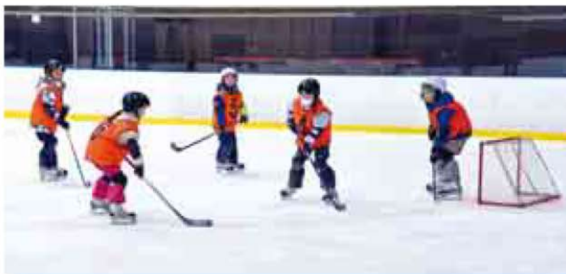
とよひら Kids アイスホッケー体験会 2月15日(月寒体育館スケートリンク)