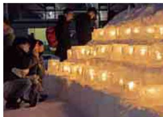
中の島アイスクンドル大作戦2020 1月27日(中の島)