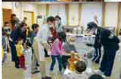
ちびっこもちつき&平岸アイスクンドルの灯り 1月31日(平岸)