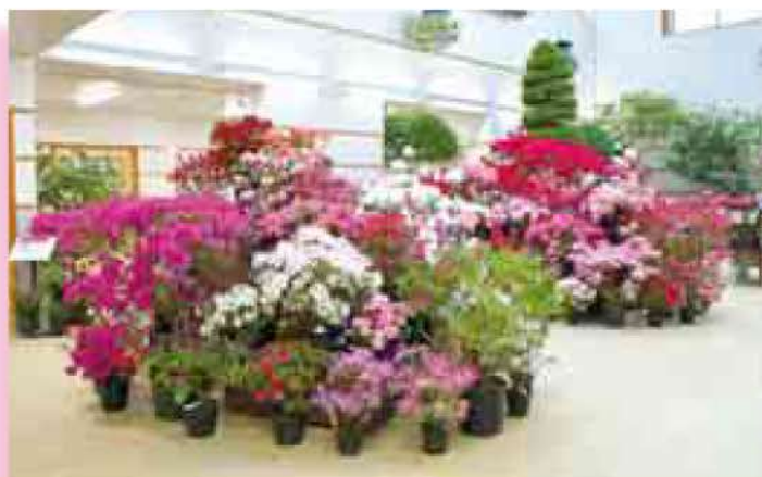
アザレア展 2月18日(豊平公園緑のセンター)