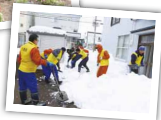
▲排雪ボランティアの様子