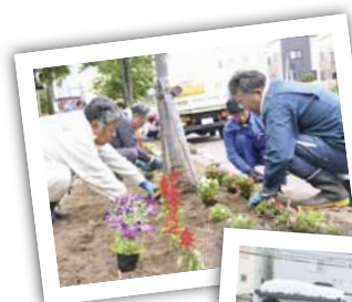
◀花壇の花植えの様子

6月ごろには、八軒地区の花壇の花植えを行っています。きれいになった花壇を見るのはとても気持ちがいいですね。冬には、八軒・八軒中央地区の高齢者のお宅の排雪ボランティアも行っていて、今シーズンも2月に実施したところ。ありがたいことに、「本当に助かる」とか「いつもありがとう」と感謝の言葉をいただくんです。利用者の安心した顔やうれしそうなお表情を見ると、続けてきて良かったと思います。