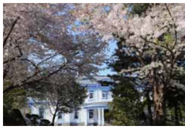
▲◀展示写真の一部。上は中島公園、左は円山公園で撮影したもの