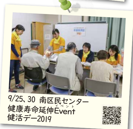
9/25、30 南区民センター 健康寿命延伸Event 健活デー2019