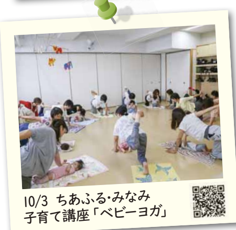
10/3 ちあふる・みなみ 子育て講座「ベビーヨガ」