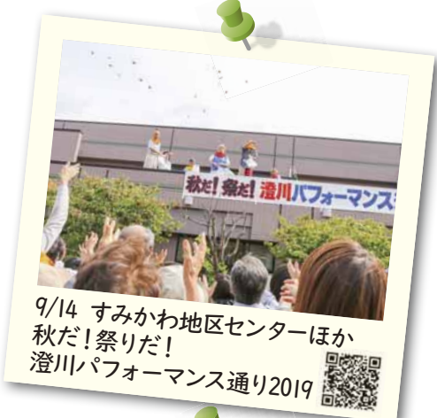
9/14 すみかわ地区センターほか 秋だ!祭だ! 澄川パフォーマンス通り2019