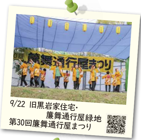
9/22 旧黒岩家住宅・ 簾舞通行屋緑地 第30回簾舞通行屋まつり