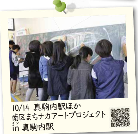
10/14 真駒内駅ほか 南区まちナカアートプロジェクト in 真駒内駅