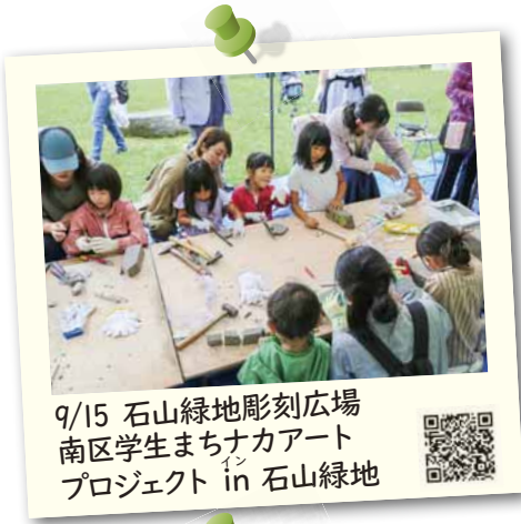
9/15 石山緑地彫刻広場 南区学生まちナカアート プロジェクト in 石山緑地