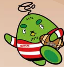
西区環境キャラクター さんかくやまベエ