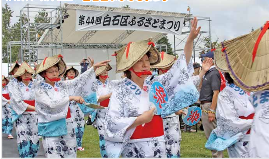
7/13、14 川下公園 白石区ふるさとまつり

白石区の人口・世帯数 ※令和元年8月1日現在 人口 212,313人 (+228) 世帯数 110,291世帯 (+144)