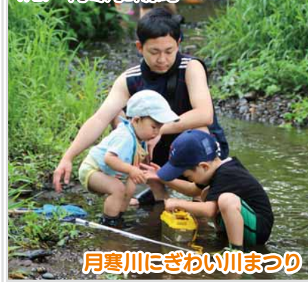
月寒川にぎわい川まつり