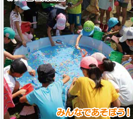
みんなであそぼう！