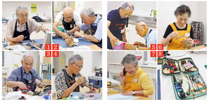
1-6: おもちゃ修理中の様子 7: 修理終了を伝える電話の様子 8: 自前の道具類 9: 作業風景 10: 迎えを待つおもちゃ

気軽にお越しください これからもたくさんのおもちゃを直し続けていきたいと思えます。皆さん、直したいおもちゃがありましたらお気軽にお越しください。