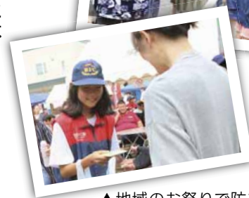
▲地域のお祭りで防火啓発のティッシュ配り。