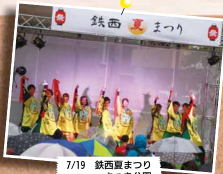
7/19 鉄西夏まつり ～さつき公園