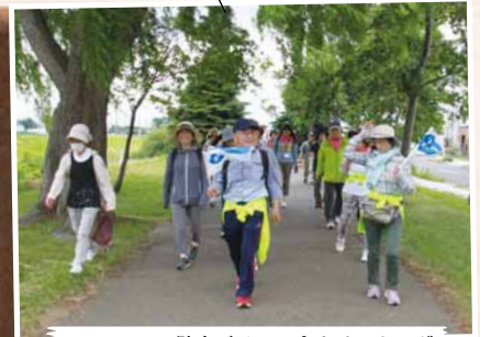
7/5 しろ健康づくりの会ウォーキング ～篠路地区など