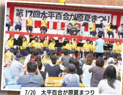
7/20 太平百合が原夏まつり ～太平あおぞら公園