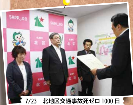
7/23 北地区交通事故死ゼロ 1000 日 達成表彰式～北区役所