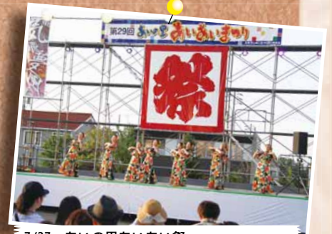
7/27 あいの里あいあい祭 ～北海道医療大学あいの里キャンパス