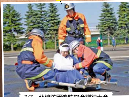
7/7 北消防団消防総合訓練大会 ～札幌市消防学校