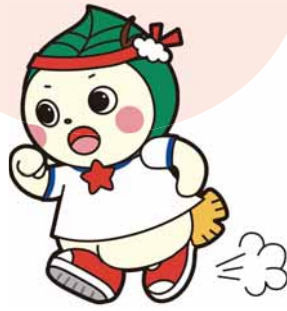
北区まちづくりキャラクター 「ほっぴい」