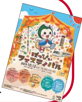
ポスターに採用された作品▶

北区は、若者の力を生かしたまちづくりに取り組んでいます。このフェスティバルのPRポスターは、「北海道芸術デザイン専門学校」の学生が制作した作品の中から、区民投票で選ばれ採用されたものです。