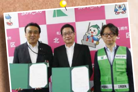
7/24 三井住友海上火災保険株式会社とのアダプト・ プログラム事業参加調印式～北区役所