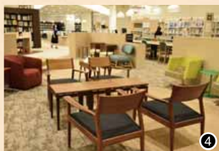
①2階の雑誌棚。②雑誌は、雑誌棚だけではなく本棚にもあります。③「建設」「金融」「エネルギー」「食品流通」など、さまざまな業界の専門新聞がずらり。④雑誌コーナー近くの椅子。