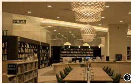
① WORKの棚。業種ごとに入門書から高額な専門書まで一つの棚にまとまっています。調査レポートや未来予測の本は貴重な情報の宝庫！②赤い枠で囲まれた通称「ハコニワ」には旬な情報。③2階の座席は約170席。