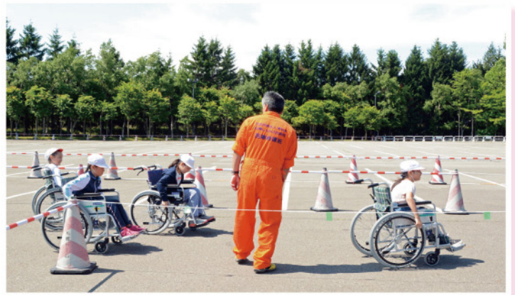
東月寒童夢セーフティフェスタ2019 7月17日(東月寒)