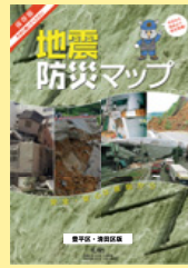
地震防災マップ (2018年11月改訂)

※総務企画課(区役所3階11番窓口)で配布しているほか、ホームページからもご覧いただけます。