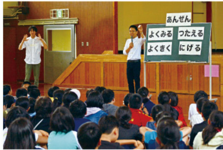
豊平区防犯教室 7月1日(みどり小学校)