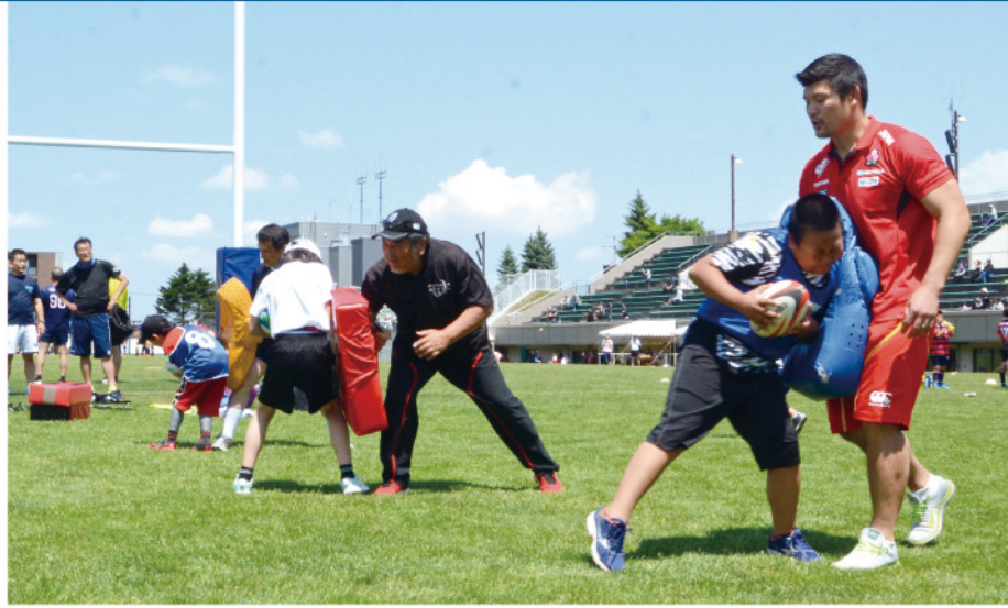
とよひらラグビー体験会 7月6日(月寒屋外競技場)