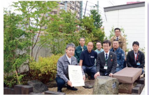
豊平区緑化協力会による庭園寄贈 7月12日(土ホセンター)