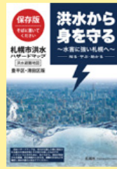
洪水ハザードマップ (2019年1月改訂)