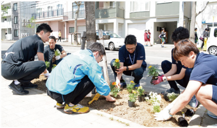
レバンガ北海道・エスポラーダ北海道の選手と町内会による植花活動 5月29日(北海きたえーる前)