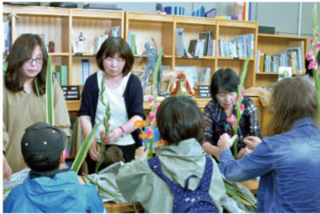
第6回天神山文化祭2019 6月29日(さっぽろ天神山アートスタジオ)