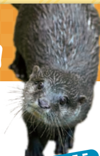
コツメカワウソのララ

サンピアザ水族館の入場料が無料になる招待券です。 申込はがき、ファクス、Eメール。希望商品名、住所、氏名、年齢、電話番号、本誌の感想を記入し、5/23(木) (必着) までに広報課(19)へ。抽選