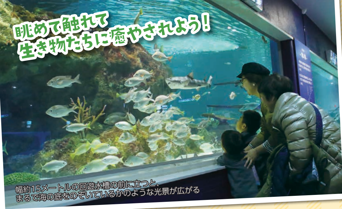
幅約15メートルの回遊水槽の前に立つと、まるで海の底をのぞいているかのような光景が広がる