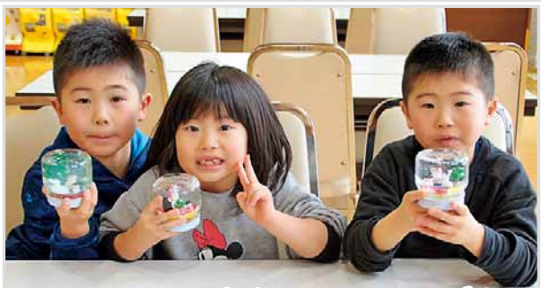
1/12 川下公園 ウィンターフェスティバル