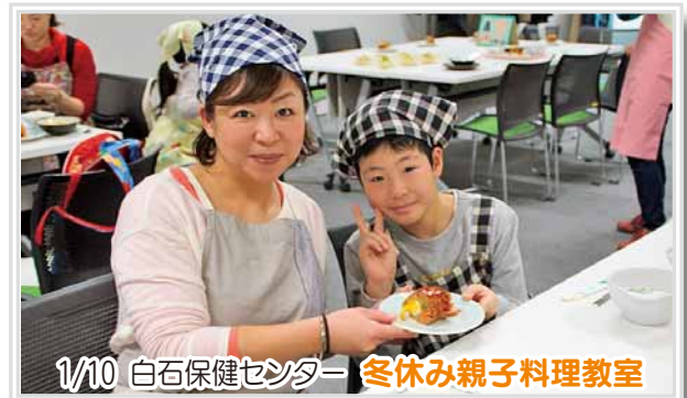
1/10 白石保健センター 冬休み親子料理教室