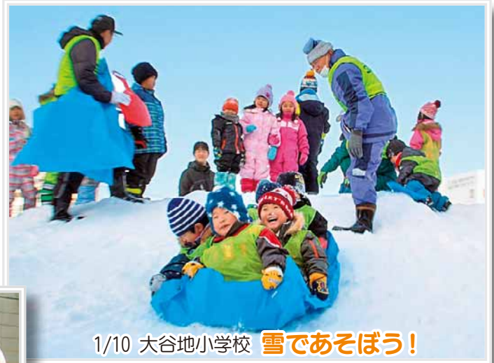
1/10 大谷地小学校 雪であそぼう!