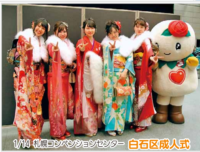
1/14 札幌コンベンションセンター 白石区成人式