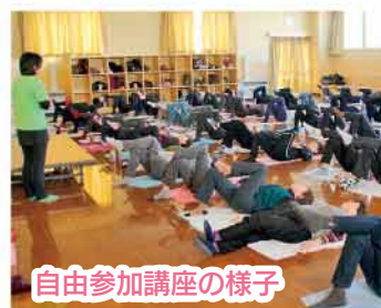
自由参加講座の様子

コーヒーを1杯100円で販売しています。散歩の途中などで立ち寄って、おしゃべりを楽しむのもオススメです。