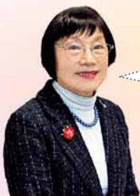
清田区民生委員児童委員協議会会長