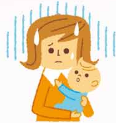
子育てに関する 心配ごとの相談