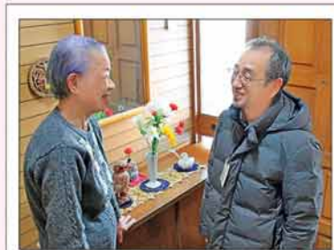
ひとり暮らし高齢者宅の訪問

現在、区内では149人が委員として活躍しています。ひとり暮らし高齢者への見守り活動、福祉に関する相談、子育てサロンの運営・協力など、地域の相談役として皆さんの暮らしをサポートしています。お住まいの地区の委員が分からないときは、区保健福祉課へお問い合わせください。