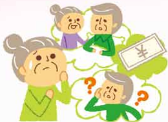
福祉に関することや 日常の困りごとの相談