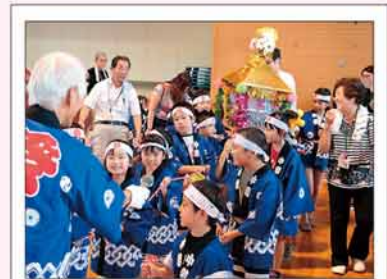
地域のお祭りでスタッフとして