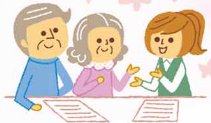
関係機関との協力・連携