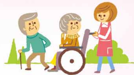
援助を必要とする人の 状況などの把握

地域のイベントを手伝ったり、中学生ランティアと配食弁当を作ったり、各域でさまざまな活動も行っています。