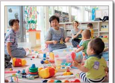
子育てサロンのスタッフとして

委員には、子どもの支援に特化して活動している「主任児童委員」が、現在、区内に10人います。いじめや不登校、児童虐待の早期発見・対応に向けて、学校や関係機関と連携し、悩みを抱える方へ支援を行います。