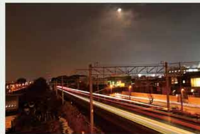
「The supermoon previousnight」 まえばし りゅうか 前橋 琉郁 さん