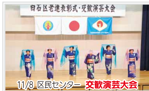
11/8 区民センター 交歓演芸大会