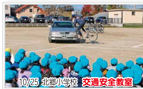
10/25 北郷小学校 交通安全教室