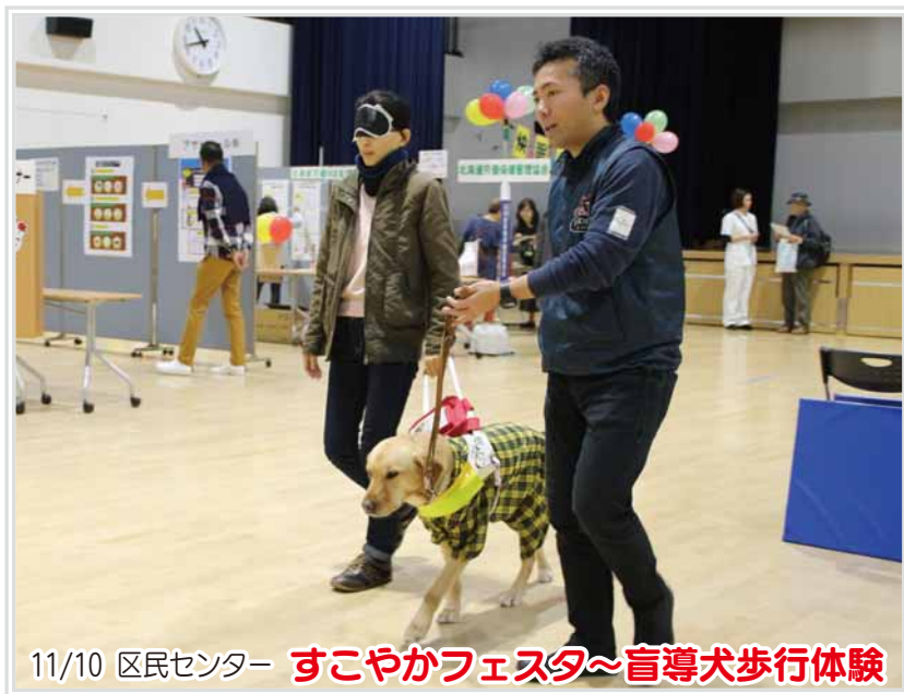
11/10 区民センター すこやかフェスタ～盲導犬歩行体験