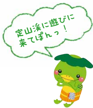
定山溪温泉PR隊長 「かつぽん」