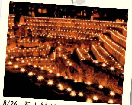
8/26 石山緑地 いしやまキャンドルナイト