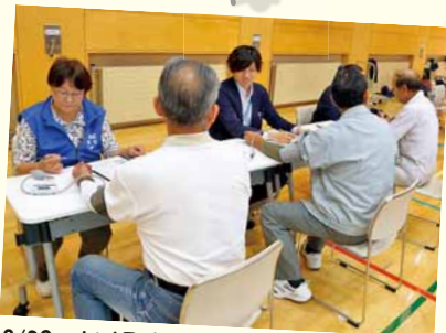
8/29 札幌市立大学内アリーナ もりの仲間のさわやかクラブ ～健康まつり2018～