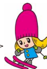
札幌国際スキー場 公式キャラクター ユツキ

ゴンドラ降り場（山頂駅舎）の屋上に紅葉時季限定で展望台が登場！小樽港や石狩港が一望できます。360度パノラマビューの眺めはおすすめ！