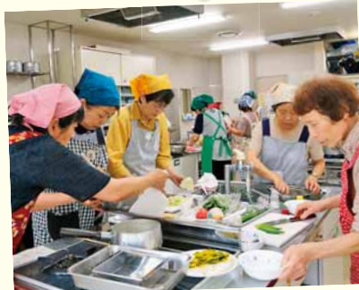
8/30 南区民センター 野菜料理教室