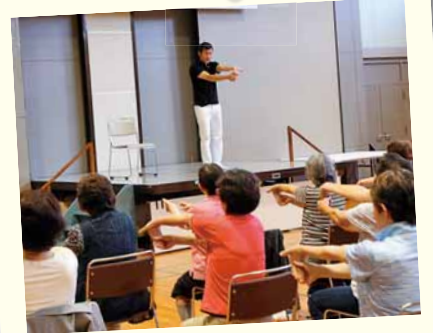
8/31 藤野地区センター 藤野いきいき元気フェスタ