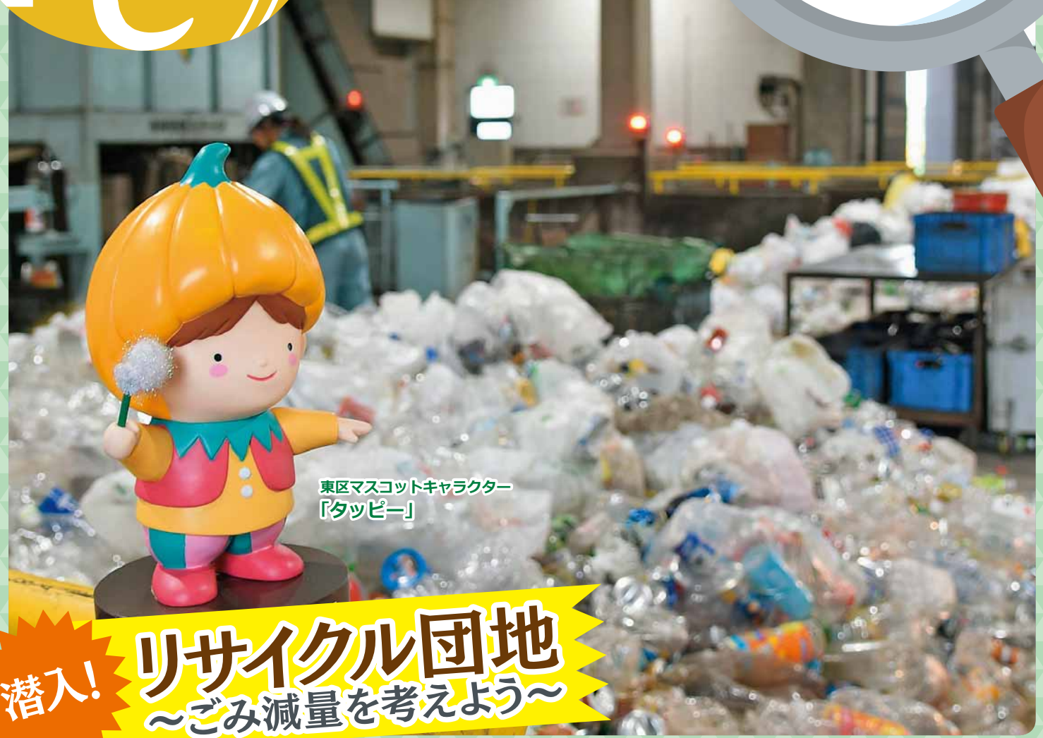
東区マスコットキャラクター「タッピー」

今月は東区中沼町の「札幌市リサイクル団地」を特集！ 家庭から出されたプラスチックや雑がみなどを資源にするための選別施設に行ってきました。 さらに、おすすめの家庭ごみを減らす方法もご紹介します。