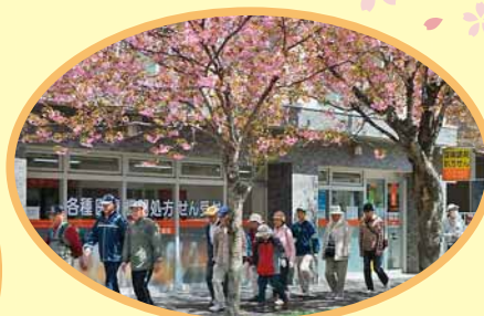
きれいな桜を見て足取りも軽やかです♪