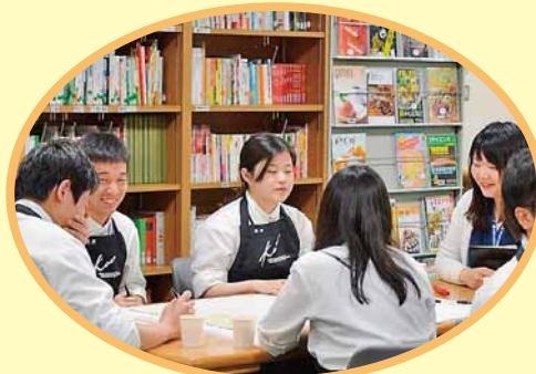
毎食の献立づくりに役立つといいな♪