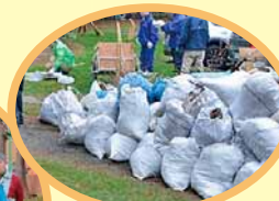
こんなにたくさんのごみを拾ったよ！