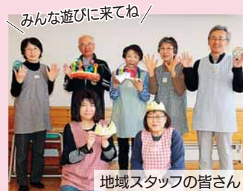
みんな遊びに来てね！

申込先 厚別保健センター ☎895-1881、E at.kenko.phn@city.sapporo.jp