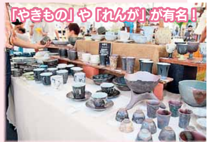
「やきもの」や「れんが」が有名!

道内の陶芸家や金属・ガラス作家を中心に、陶芸サークルや飲食店など約300店が出店。作家と直接対面して焼き物を購入できるとも貴重な機会です。