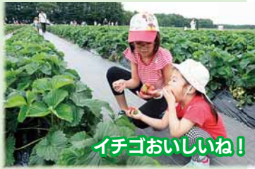
イチゴおいしいね!

北広島市内には、6カ所のイチゴ農園があり、毎年6月頃から7月頃までイチゴ狩りを楽しめます。