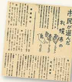
▲昭和35年12月号の広報さっぽろ

市民投票により、札幌市の花・木・鳥がそれぞれスズラン・ライラック・カッコウに決定。この投票は人口50万人を突破したことを記念して行ったもので、花と木は各10種類、鳥は11種類の中から選ばれた。