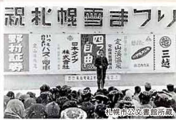
◀第1回雪まつりの雪像と開会式

中高生が大通公園に6つの雪像を制作したことから始まった雪まつり。初回は雪像の展示のほか、ドッグレースや野外映画会などが行われ、5万人が来場した。