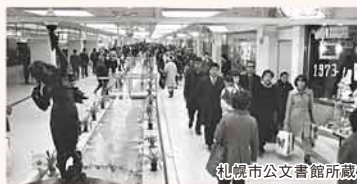
▲完成当時、中央に水路があった地下街オーロラタウン

2年後の札幌オリンピック開催に向け、駅前通では道路の拡幅工事や地下鉄の建設などが進められた。1971(昭和46)年には地下鉄南北線が開通、地下街も完成した。