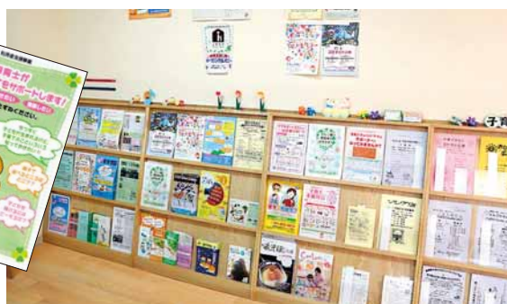
▲パンフレットコーナー