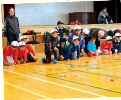
3/25 石山小学校 石山地区チョロQ大会