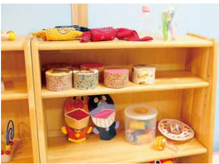
▲手作りおもちゃの展示コーナー

手作りおもちゃの見本を展示しています。ペットボトルやお菓子の空き容器など、身近なもので作れるおもちゃばかりです。作り方のレシピも配布していますので、ご自由にお持ちください。