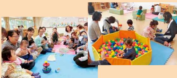
▲ちあふる・みなみの子育てサロン「さくらんぼのへや」

子育て家庭が自由に集い、他の親子や地域の方々と交流することができます。保護者同士の情報交換の場としても、気軽にご利用ください。各サロンの開館時間などは、「さっぽろ子育て情報サイト」や「さっぽろ子育てアプリ」でご確認ください。