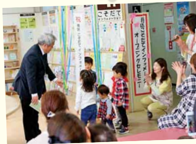
4/2 南保健センター こぞがインフォメーション オープニングセレモニー