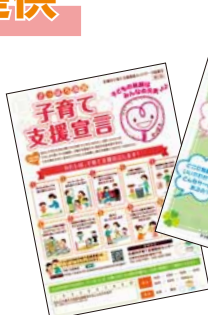
▲各種チラシや パンフレット

子育てサロンや親子で遊べる場所、イベントなどの情報を提供しているほか、保育園のおすすめ料理レシピなどを配布しています。近くにいらした時にふらっと立ち寄り、パンフレットなどをお持ち帰りいただくだけでもOKです！