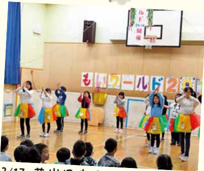
3/17 藻岩児童会館 もいワールド

南区役所総務企画課広聴係 〒005-8612 南区真駒内幸町2丁目2-1 ☎582-4714 南区のホームページ http://www.city.sapporo.jp/minami/