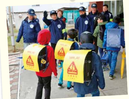
4/11 南小学校 春の児童見守り運動