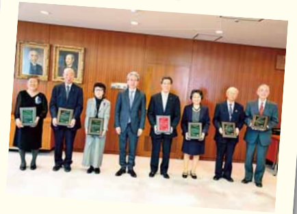
3/28 札幌市役所 札幌市ぬくもり・すこやか表彰式