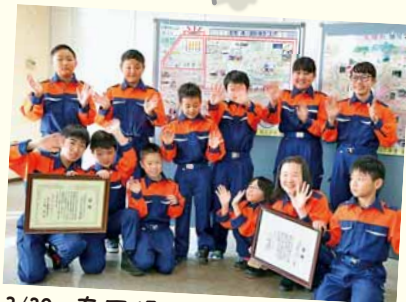
3/29 南区役所 川治少年消防クラブ 防災マップ入賞報告会