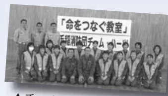
▲チームハーツのメンバー

チームハーツの誇れるポイント ～平成29年の活動実績～ 救命講習・救急指導 41回 レベルアップ研修 8回