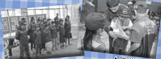
▲火災予防運動街頭啓発

区内には5つの少年消防クラブ(通称BFC)があり、現在117人の子どもたちが所属しています。応急手当訓練や街頭啓発など、1年に 約60回 の活動を行っており、災害時の対応に関する知識を深めています。