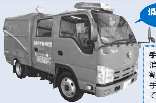
消防団専用の消防車

地域に密着した消防機関として手稲消防署と連携しながら消火活動や火災予防啓発などを行います。普段は会社員、主婦、大学生、専門学校生など、さまざまな分野で活躍する135人が団員として所属しています。