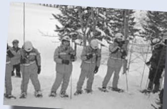
▲冬の手稲山での実技訓練

◆消防団は山にも出動! 手稲消防団には北海道科学大学の学生16人を含む、26人で構成された山岳救助隊があります。昨年は手稲山で遭難者の捜索活動のため出動しました。