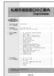
【相談窓口のご案内】