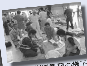
▲救命指導講習の様子

チームハーツは、救命率の向上を目指して平成19年に手稲消防団の女性団員で結成。現在30人が所属し、高校生向け救命指導講習や救急指導レベルアップ研修など、1年を通じて活発に活動しています。