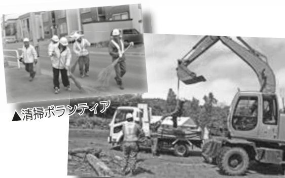
▲清掃ボランティア