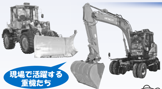
現場で活躍する重機たち

毎年春に区内全小学校の通学路を中心にボランティアで清掃活動を行っているほか、交通安全街頭啓発など地域にも貢献しています。