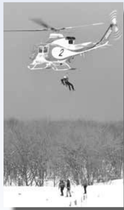
▲消防ヘリコプターとの連携訓練