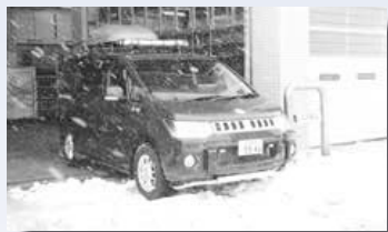
▲手稲消防署から出動する山岳救助車