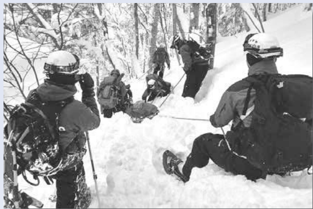
▲手稲山での雪中救助訓練

災害が発生したときに現場に駆け付ける心強い味方がいます。彼らは、災害に備えて訓練を積み重ね、皆さんの安全と安心を守るために日頃からさまざまな活動を行っています。今月号では、区内で活躍する『手稲消防署山岳救助隊』、『手稲消防団』、『手稲区災害防止協力会』の活動を紹介します。