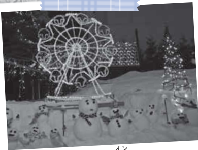
スノーフェスティバル イン 澄川-2018-