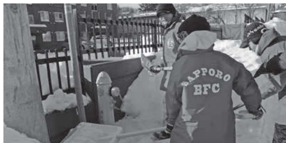
▲災害時に備えて消火栓の周りを丁寧に除雪。