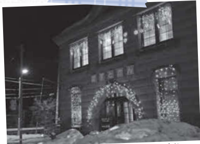
石山スノーファンタジー「まちの灯り」 あか