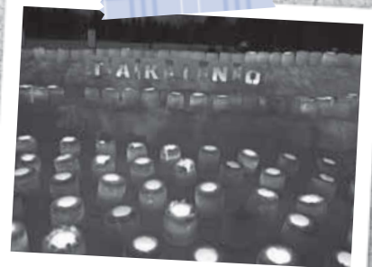
滝野スノーフェスティバル