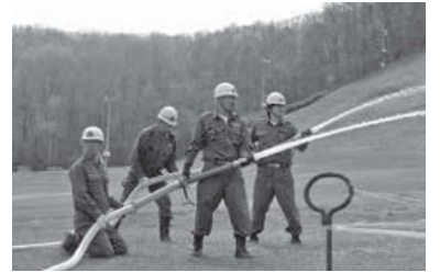
▲各分団の連携による一斉放水。

森林の面積が広い南区では、特に野火や林野火災への備えが必要です。水の確保などが限られる状況において、消火手順を確かめながら、訓練を行います。