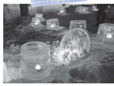
藻岩下やさしい雪あかり