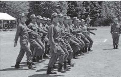
▲指揮者の号令に合わせて行進。

分団ごとに規律ある行進を披露する「小隊訓練」、消火やロープ結索などの動作を行う「現場活動訓練」の2種目で、日頃の訓練の成果を競い合います。