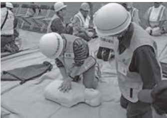
▲応急手当の資格を持つ団員で結成された「救命指導コースモス隊」による指導。

地域の防災訓練や行事に参加し、応急手当の方法を地域の方に教えるなど、地域防災力を高める取り組みを行っています。