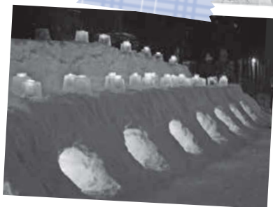
藻岩地区アイスクャンドル