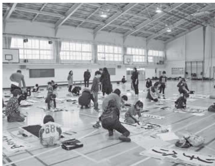
☆掲載写真は、南区のホームページでカラーで公開しています。