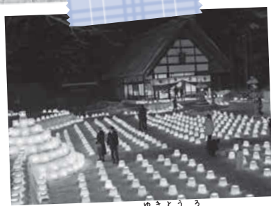
定山溪温泉雪灯路2018 ゆきとうろ