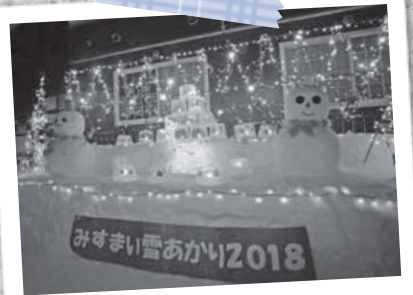
みすまい雪あかり