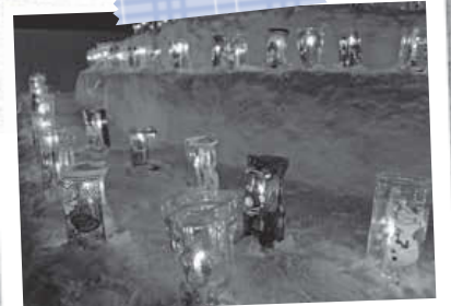
南沢地区冬まつり