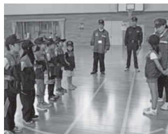
▲規律訓練では、団体行動の大切さを学びます。

災害時に自分で考えて行動する力や、規律や団体行動の基本などを身に付けることができます。地域の方に見守られながら一緒に活動することで、将来は地域の防災を担う一員となってくれることを願っています。