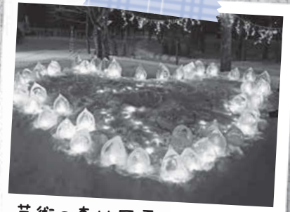
芸術の森地区雪あかりの祭典