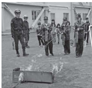
▲消火器の使用方法を習得。

消防士などに教わりながら、消火体験や研修などを通して、防災に役立つ知識や技術を習得します。