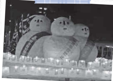
真駒内地区ふれあい「雪あかり」