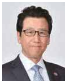
札幌市長 あきもと かずひろ 秋元 克広

札幌市広報課 〒060-8611 中央区北1西2 ☎211-2036 FAX218-5161 Eメール kohokakari@city.sapporo.jp