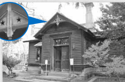
▲建築時から移築しておらず、当時の様子が保たれている