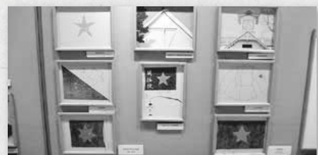
▲北海道庁旧本庁舎では外観の五稜星だけでなく、文書館展示室で北辰旗の歴史を示した資料も見られる

開拓使が手掛けた建物には所々に五稜星が付けられた。例えば時計台には、建物全体で大小17の星が使われている。