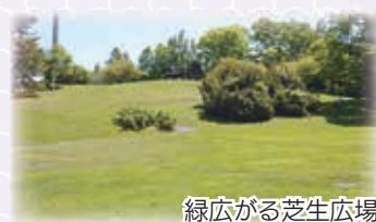
緑広がる芝生広場

平岸高台公園は、斜面に広がる大きな芝生広場と美しい景色を眺望できる 丘の上の展望台 が特長の公園で、天気の良い日には遠くの手稲山まで一望できるなど、駅の近くからでも札幌の雄大な自然を感じることができる絶景スポットとなっています。また、地元テレビ局の人気バラエティー番組でロケ地として使用されたことからとても有名になり、全国各地から多くのファンが訪れています。