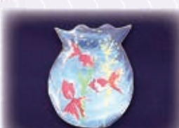
▲ワークショップで体験できる小物作りの作品例。内容は随時変更されます。