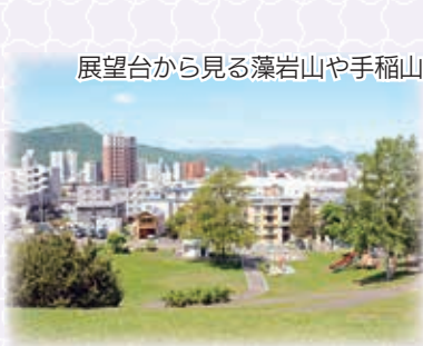
展望台から見る藻岩山や手稲山

平岸高台公園は、斜面に広がる大きな芝生広場と美しい景色を眺望できる 丘の上の展望台 が特長の公園で、天気の良い日には遠くの手稲山まで一望できるなど、駅の近くからでも札幌の雄大な自然を感じることができる絶景スポットとなっています。また、地元テレビ局の人気バラエティー番組でロケ地として使用されたことからとても有名になり、全国各地から多くのファンが訪れています。