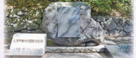
▲句碑は、啄木が知人女性の実家風景(現・東区)を歌ったもので、「石狩の都の外の君が家林檎の花の散りてやあらむ」と刻まれています。