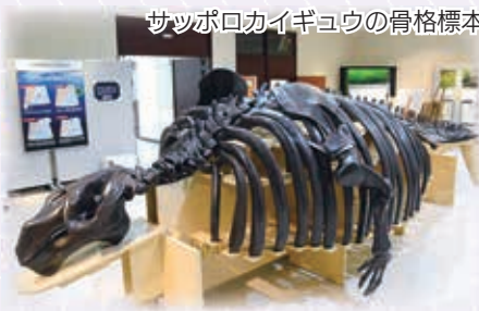
サッポロカイギユウの骨格標本