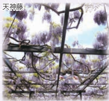
▲天神藤は、毎年5月下旬～6月上旬の開花時期に限り一般開放されます。 ※29年度の一般開放は終了しました。