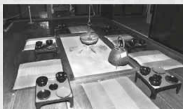
▲居間の中央にはいろいろがあり、利用客の憩いの場になっていた

簾舞通行屋は市中心部と定山溪の間に建てられ、行き交う人に利用された。現在は客間や黒岩家が生活した部屋のほか、共用部分であった居間などを見ることができる。