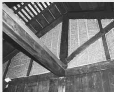
▶居間の天井を見上げると、立派な柱が見られる

1872(明治5)年に建てられた旧棟は、中島公園にある豊平館などに見られる洋風小屋組といわれる造り。道内の建築物ではその当時先駆けだった。増築した新棟は、納屋や馬小屋を併設しており、開拓時代初期の家屋構造の特徴を知ることができる。